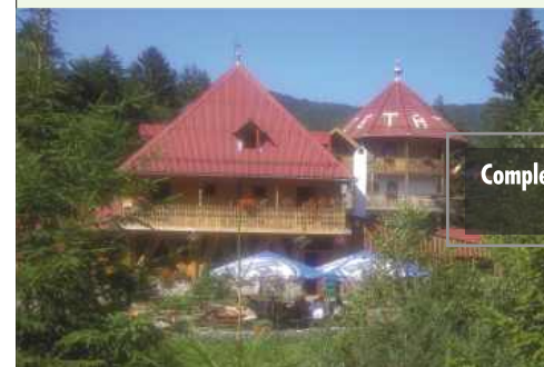
Complex "Cetate" (3***) Balvanyos Tel/Fax: 0267-361130

527160 Turia nr. 3, jud. Covasna, Tg. Secuiesc Curtea 12 nr. 2 • tel./fax: 0040-267-361.130, 367.111, 360.706 Mobil: 0070-744-380.000, 0040-741 077 903 • E-mail: dar@planet.ro www.Balvanyos.proturism.ro , www.imobdar.ro