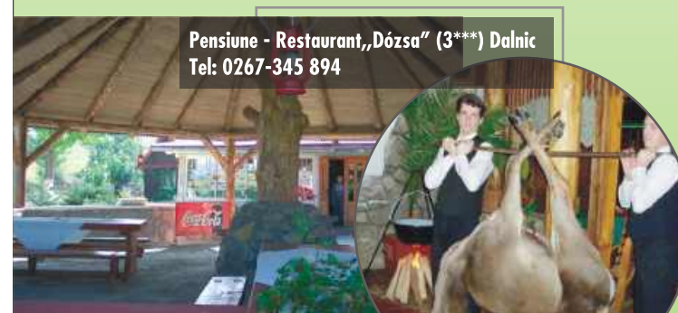
Pensiune - Restaurant „Dózsa” (3***) Dalnic Tel: 0267-345 894