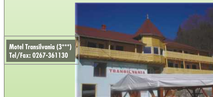
Motel Transilvania (3***) Tel/Fax: 0267-361130